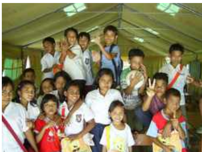
2005, les écoliers sous la tente-école Unicef