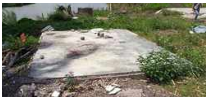
Décembre 2004, il ne reste que les dalles de l' école