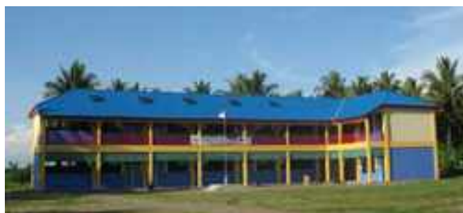
Mars 2006, la nouvelle école est finie