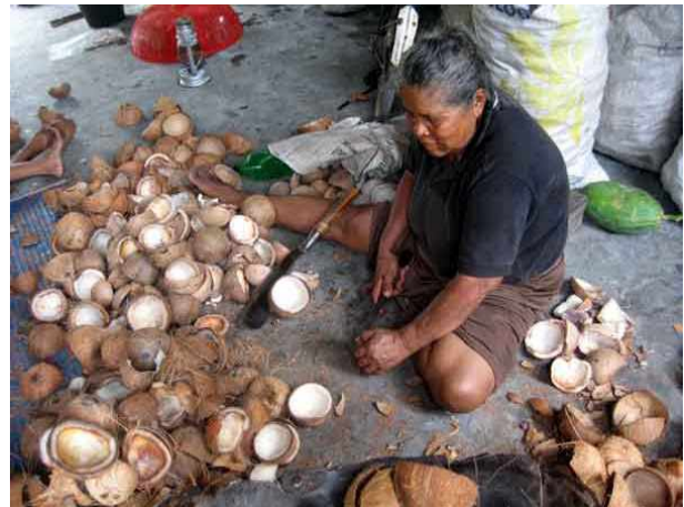
Les noix sont ouvertes pour libérer l'amande.