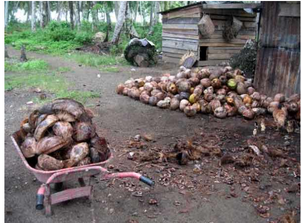
Les noix de coco sont achetées aux propriétaires des terrains proches et rapportées à la maison dans des brouettes.