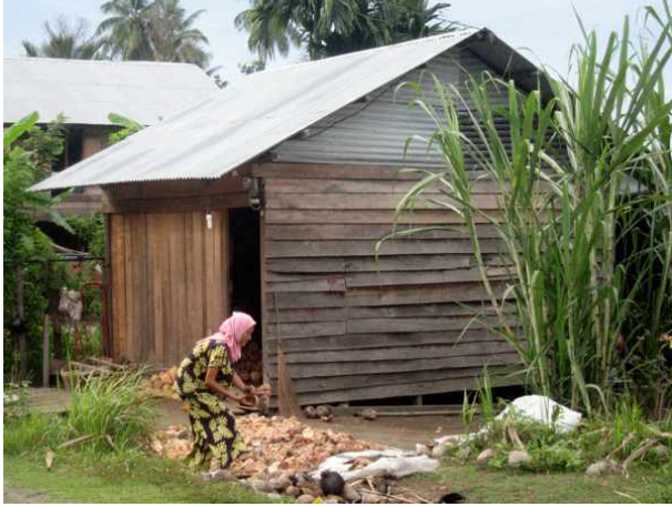
La fabrication du coprah est une activité recherchée par les femmes au foyer. Elles peuvent s'occuper de leurs enfants tout en travaillant à leur rythme.