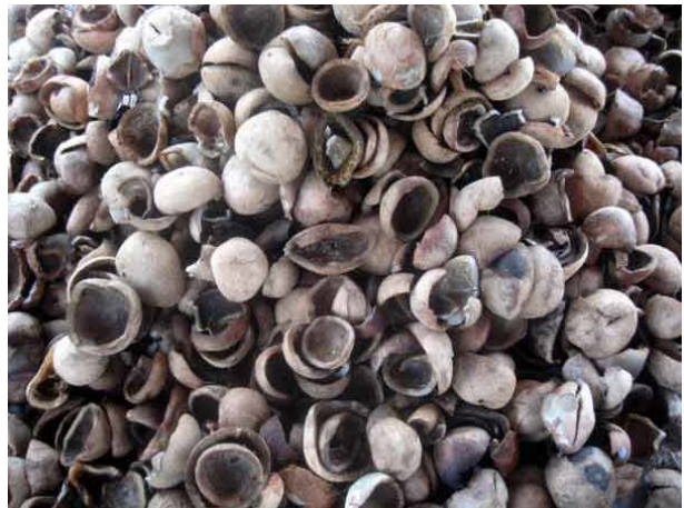
Les amandes sont séchées au soleil ou dans un four.