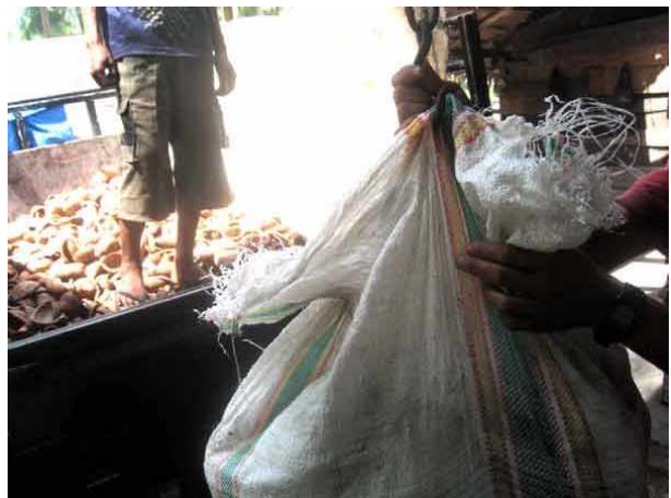
Des acheteurs de Medan (18 heures de route, zone où se trouvent les raffineries) parcourent les villages pour acheter la production locale.